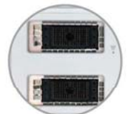
Conector dual de transductores