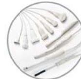
Abundante familia de transductores