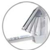
Monitor LCD de 15" con angulación, facilita la visualización